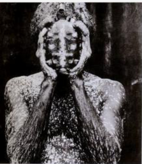
Le dieu de la tête, 1988.