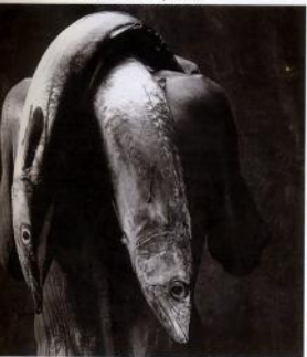
L'homme aux deux poissons, 1992.